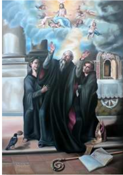
Trépas de Saint Benoît

🌸 chez les Cisterciens : Mémoire Facultative