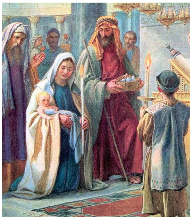
La Présentation du Seigneur

Saint Bernard, Abbé et Docteur de l'Eglise (1091-1153)