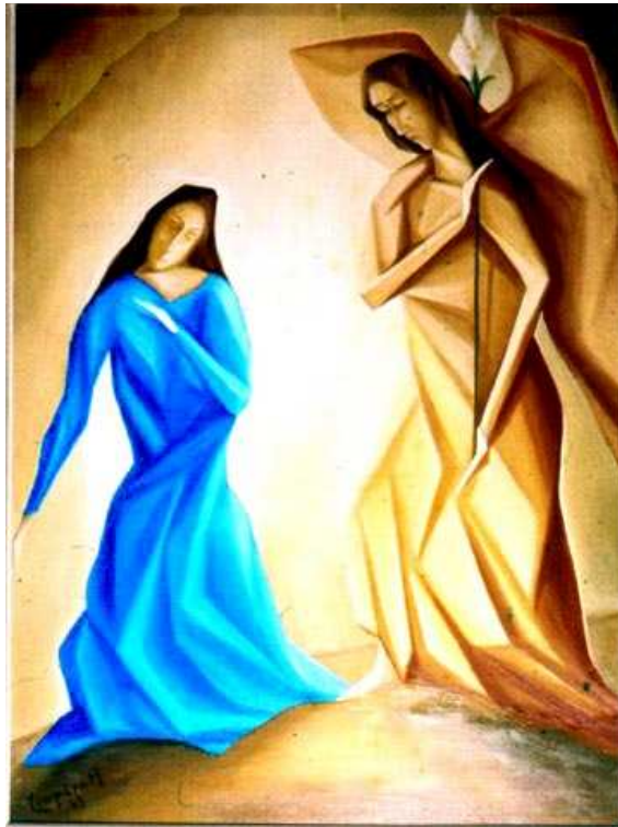
L'Annonciation du Seigneur

Dom Anselm Grün, Moine bénédictin (1945)